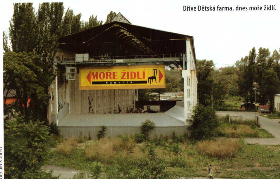
Dříve Dětská farma, dnes moře židlí.