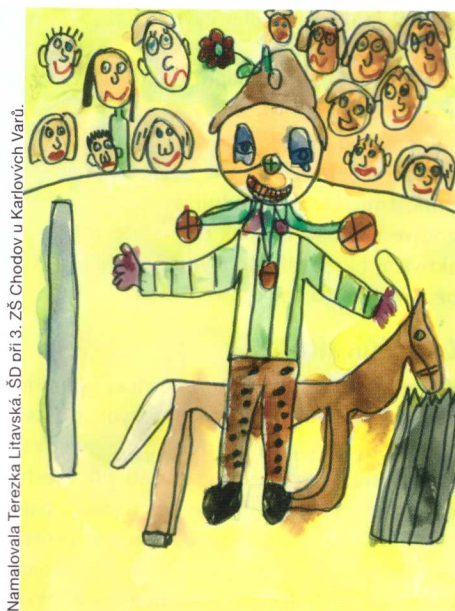
Namalovala Tereza Litavská. ŠD při 3. ZŠ Chodov u Karlových Varů.

Výzkumné studie o pořadí narození však docházejí k obecnému závěru, že druhorození jsou do jisté míry protiklady prvorozených. Protože se později narozené děti „odrážejí“ od těch, které se narodily bezprostředně před nimi, nelze předvídat, jakým směrem půjdou. Charakteristické