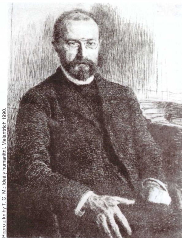
Repro z knihy T. G. M.: Ideály humanitní, Melantrich 1990.

Výsledkem tohoto incidentu bylo vyloučení z gymnázia, ale Masarykovi přálo štěstí. Brněnský policejní ředitel, jehož nemoc-