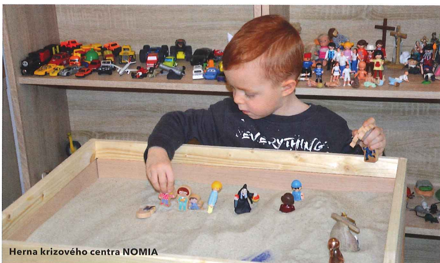
Herna krizového centra NOMIA

Takové příběhy se odehrávají ve všech městech, den co den. Některé z nich jsou ještě smutnější, neboť za zdmi domů a bytů, které se navenek tváří spořádaně, doprovází hádky a neshody také násilí. Od nadávek, výhrůžek, po slovní i fyzické útoky. Málokdo se s takovouto situací svěřil okolí a málokdo z okolí pozná, že se tomu dotyčnému dějí takové zlé věci.